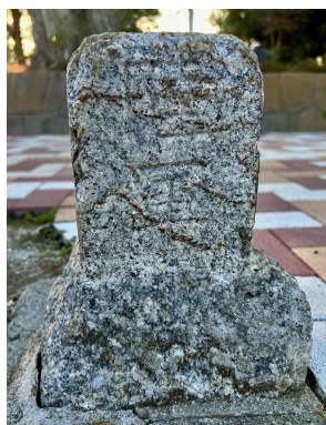
馬橋公園東口に残る 軍用地境界標石