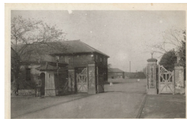
中野駅北側にあった 中野電信第一総隊